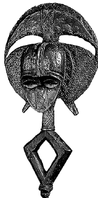
La copertina del libro della Forum su Attilio Pecile, un'immagine dell'esploratore fagagnese e un'opera artistica della tribù dei Makoko; sotto il loro re nel 1882