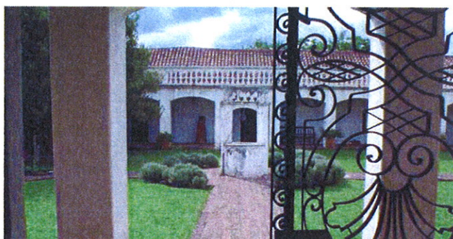
Casa Copetti, Colonia Caroya, la città argentina che venne più volte visitata da Ottavio Valerio