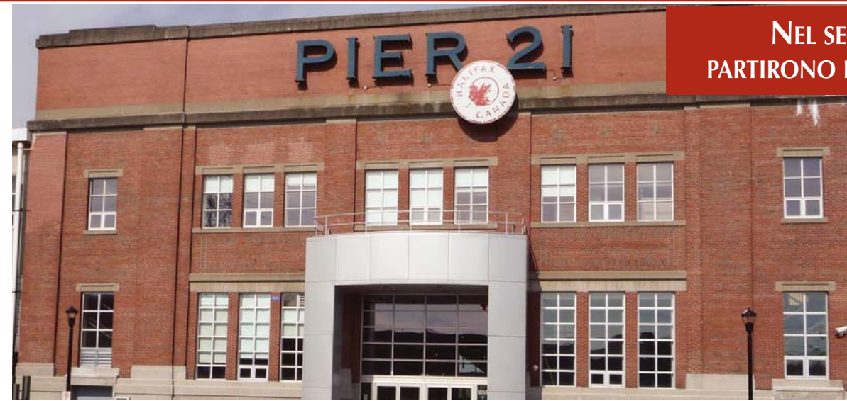
Porto di Halifax, il molo 21 porta d'ingresso dei friulani in Canada

REGIONE AUTONOMA FRIULI VENEZIA GIULIA servizio corregionali all'estero e lingue minoritarie