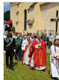
Ss. Pietro e Paolo a Tarvisio