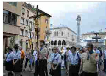
Corpus Domini 2014