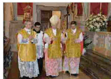
Guarda le foto del 250° del Duomo di Tolmezzo