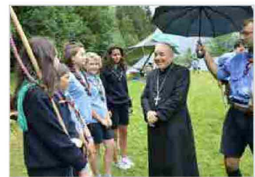
L'Arcivescovo al campo scout 24 lug | 20:45

Le prime pubblicazioni di Tavan risalgono alla metà degli anni Ottanta quando, per i Quaderni del Menocchio, sono usciti Macheri, Lètera, Cjant dai dalz e Nâf spaziâl. È,