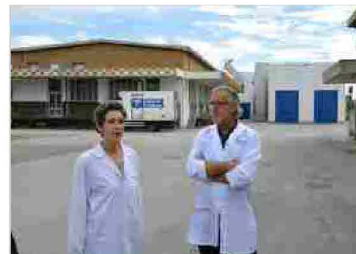
Latterie Friulane apre le porte dopo lo scandalo aflatossine

La serata si svolgerà nella Sala Astra. Per maggiori informazioni sul programma di Visionario d'Estate consultare il sito www.visionario.info , la pagina www.facebook.com/VisionarioUdine o contattare lo 0432/227798.