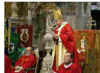
Santa Messa solenne per i santi Patroni, Ermacora e Fortunato - Udine, 12 luglio 2014 12 lug | 17:13