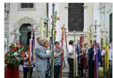
Primi Vespri della solennità dei S. Patroni Ermacora e Fortunato 11 lug | 21:54