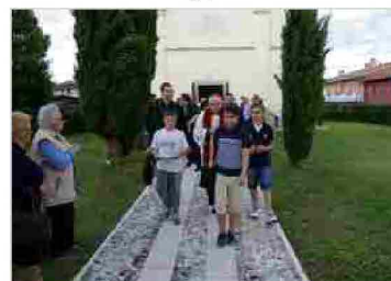
Inaugurazione della «Cjase da la Curtine» a Zompicchia di Codroipo - 30 giugno 2014